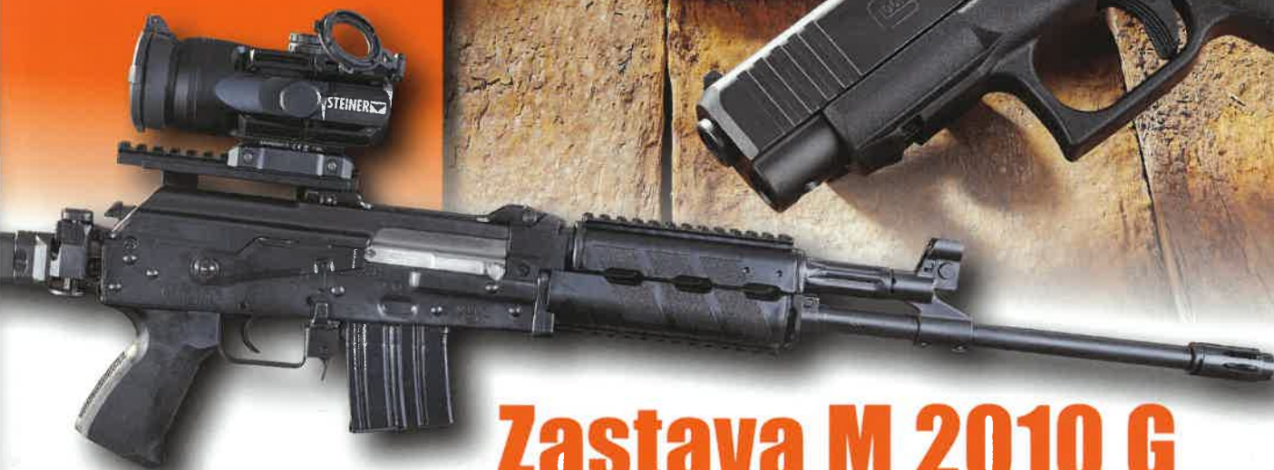
Zastava M 2010 G

Und: Schwerpunkt KK 1 Bergara, 1 Walther, 1 Kriss, 1 CZ-Wechselsystem