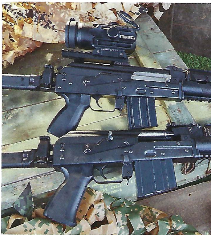
Nur die Version in .308 Winchester (v.) hat einen Verschlussfang. Der Unterschied der Magazine ist beträchtlich.

Testwaffen und Schwabe-Optiken: Waffen Schumacher, ( www.waffenschumacher.com ); Steiner ZF 4 x 32: Steiner Optik ( www.steiner.de ), vielen Dank!